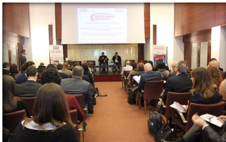
LA PLATEA DELL'EVENTO

Alcuni partecipanti hanno espresso la volontà di avere maggiore possibilità di dibattito e interazione con relatori e moderatori e di aprire ad una sessione di "domande e risposte".