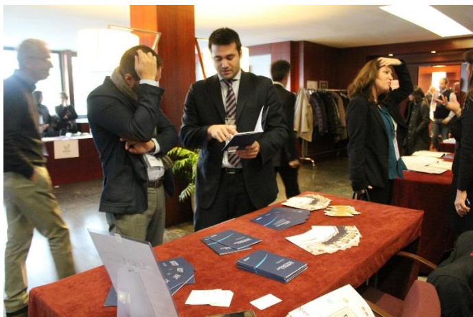
MOMENTO DI NETWORKING

Agli Sponsor e agli espositori è stato assegnato un desk nella hall dell'albergo, attigua alla sala del convegno, per accogliere il pubblico interessato durante le pause e distribuire materiale informativo e promozionale.