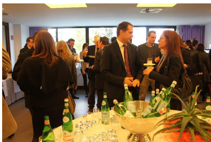
MOMENTO DI NETWORKING 2