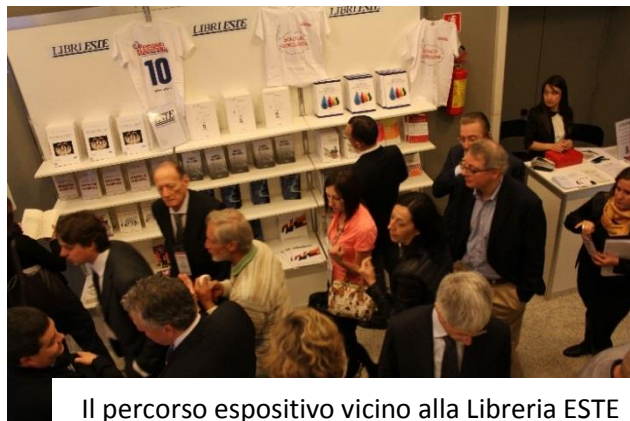
Il percorso espositivo vicino alla Libreria ESTE