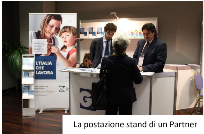
La postazione stand di un Partner

Di seguito la tabella con dettaglio del numero di incontri pianificati per ciascuna azienda e il numero di appuntamenti effettivamente concretizzatisi nella giornata: