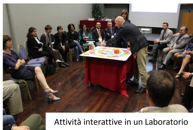
Attività interattive in un Laboratorio