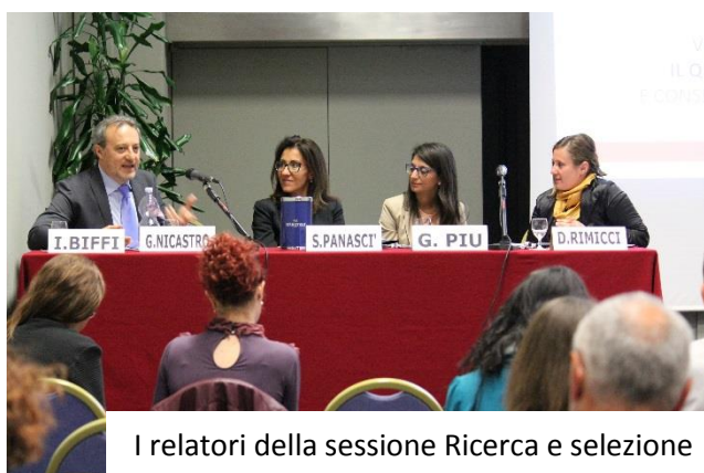
I relatori della sessione Ricerca e selezione

Alle 17.30 i lavori sono continuati all'interno di sei Laboratori di approfondimento, i cui contenuti sono stati curati dalle aziende Partner e Sponsor della giornata, che hanno avuto modo di coinvolgere all'interno della propria sessione un numero ristretto di partecipanti come spettatori. I visitatori hanno espresso la propria preferenza per una delle sessioni all'atto della registrazione all'evento e dietro successiva richiesta della Segreteria Organizzativa, per i Laboratori.