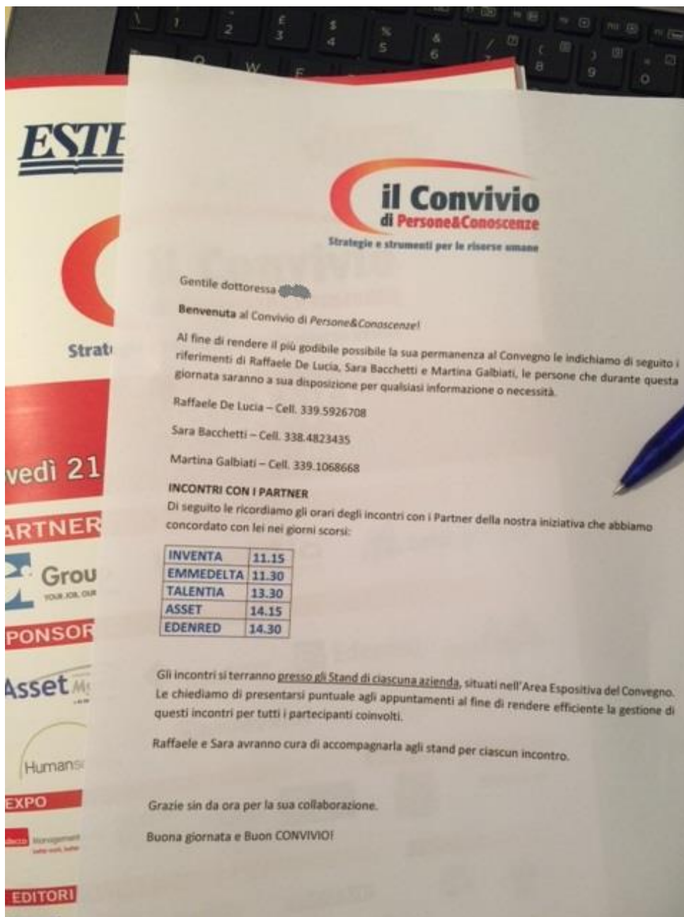
Foto dell'agenda personalizzata consegnata ad uno dei partecipanti del Convivio con cui sono stati fissati incontri con le aziende Partner, Sponsor ed Expo.