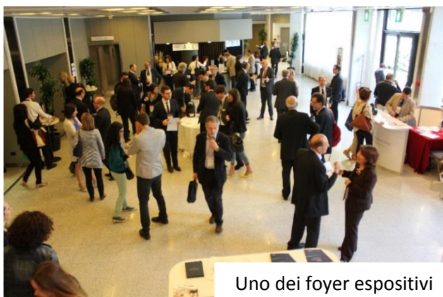
Uno dei foyer espositivi

Il 95% dei partecipanti ha espresso un giudizio compreso fra Buono e Ottimo relativo all'organizzazione dell'Area Espositiva.