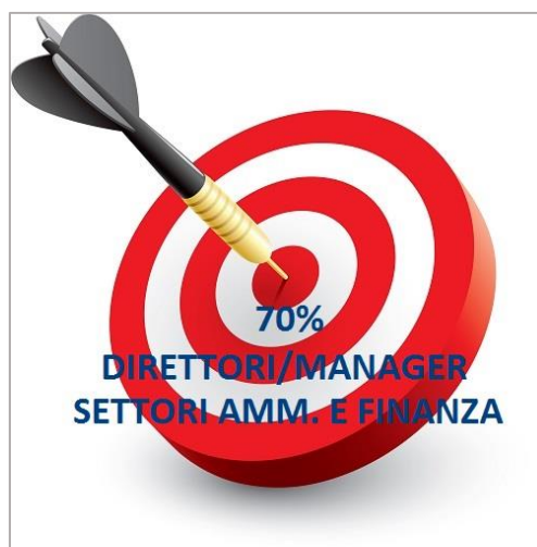
Percentuale degli iscritti secondo le funzioni

Il Convegno prevedeva la partecipazione gratuita ed era riservato principalmente a CFO, direttori pianificazione e controllo, responsabili controllo di gestione e responsabili amministrazione.