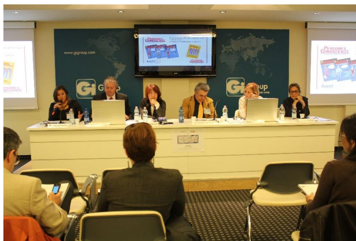
Il tavolo dei relatori