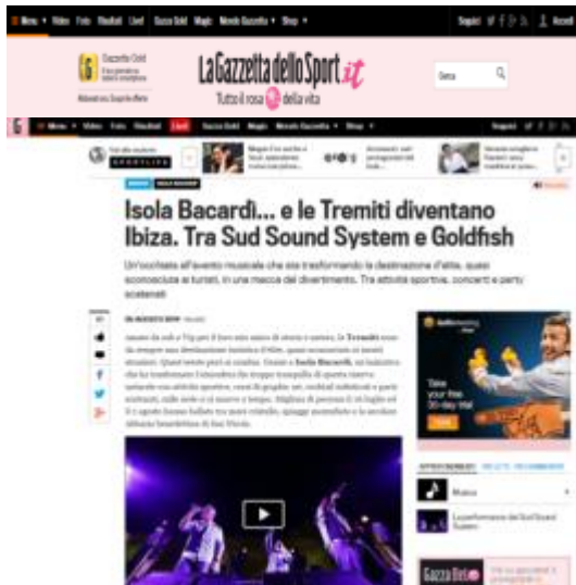
Gazzetta dello Sport