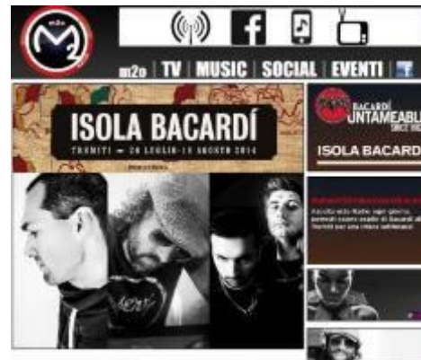
10 LIVE DALL'ISOLA