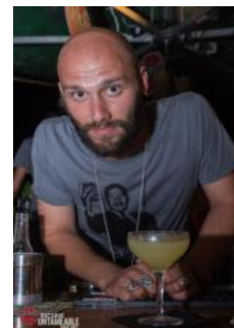
Bugiada, Freni e Frizioni, Roma