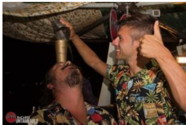
Dalla Pola, Nu Lounge (Bologna) Vanzan, freelance