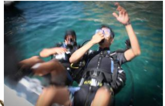
DIVING NEI PIU' BEI FONDALI DELL' ISOLA