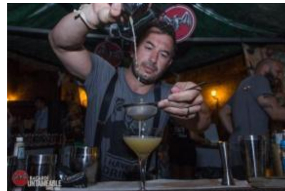
Gosso, Lùtece, Torino