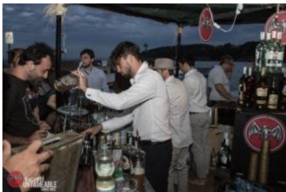
Russo, 1930, Milano