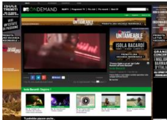
CANALE BACARDI CON VIDEOCLIP DALL' ISOLA