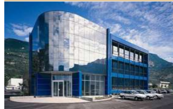
ZF Padova Srl – location Arco