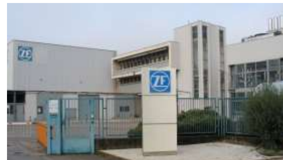
ZF Padova Srl