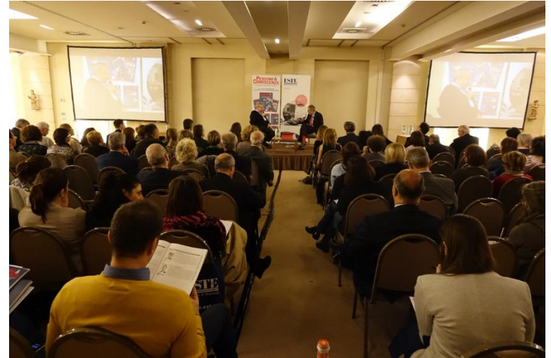
La platea della sessione plenaria