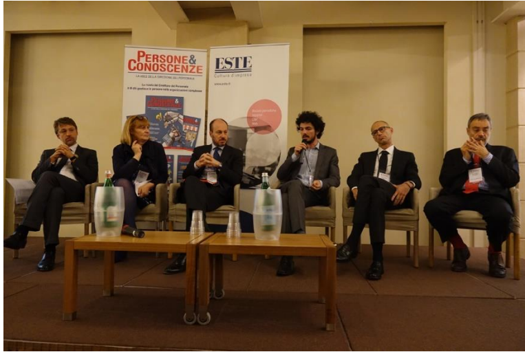
La tavola rotonda tra i direttori HR ed esperti delle aziende partner