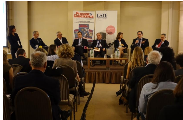
La tavola rotonda tra i direttori HR ed esperti delle aziende partner