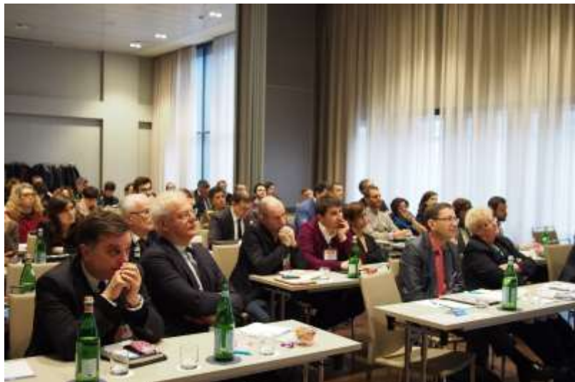
La platea in sala