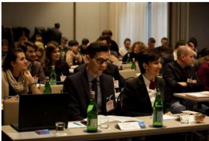
La platea in sala