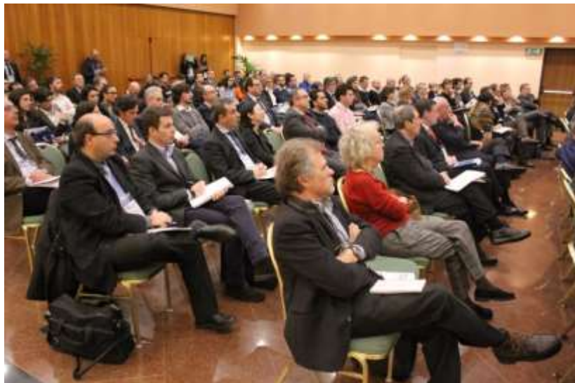
La platea in sala