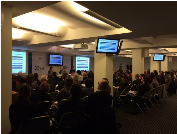
La platea del convegno durante la presentazione dei risultati della ricerca