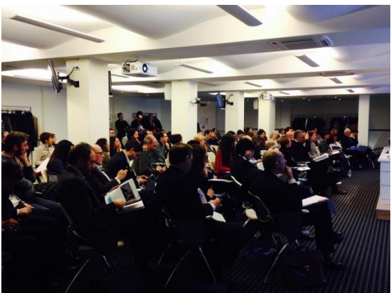
La platea del convegno durante la tavola rotonda