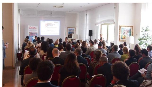
La platea dell'evento