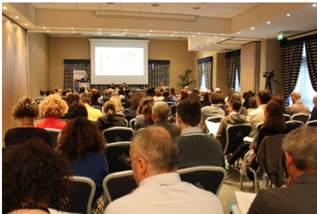
LA PLATEA DELL'EVENTO

Le organizzazioni devono porre una maggiore attenzione alla promozione di condizioni necessarie per un ambiente di lavoro positivo e stimolante .