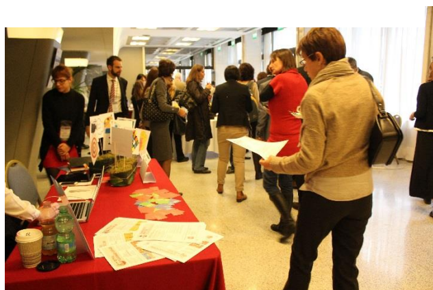
Uno scorcio dell'area espositiva