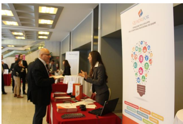
Esempio dei desk degli sponsor all'interno dell'area espositiva