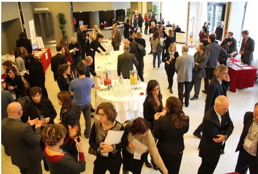
Area espositiva e ristoro con i desk di alcune aziende sponsor e expo

Ciascuno Sponsor e Espositore presidiava un desk all'interno dell'area espositiva, per agevolare il contatto con i partecipanti e la diffusione del materiale informativo.