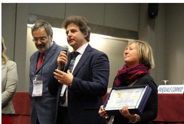
Il momento della premiazione a IVN, vincitore della seconda edizione del Premio Prodotto Formativo dell'anno IVN.

Il premio è stato assegnato a IVN che ha proposto il prodotto formativo Change the Wor(l)d , che fa uso della scrittura "come strumento maieutico per meglio capire se stessi e il mondo che ci circonda".