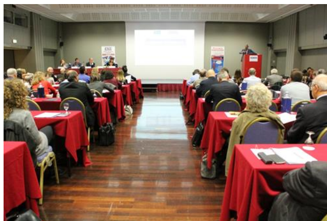
Uno scorcio della sala plenaria

Il convegno è stato promosso presso aziende di media-grande dimensione del Nord-Ovest (Lombardia, Piemonte, Liguria, Veneto ed Emilia Romagna). Le organizzazioni coinvolte sono trasversali per tipologia di attività e il pubblico è formato da Responsabili della formazione e dello sviluppo, Responsabili Risorse Umane, Direzione Generale, Formatori interni ed esterni e Consulenti e Organizzazioni in ambito formativo.