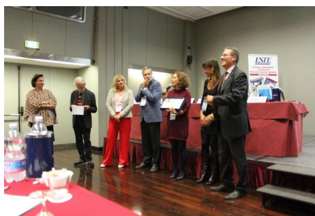
La Giuria del Concorso premia uno dei candidati, Granchi & Partner, con una menzione speciale.