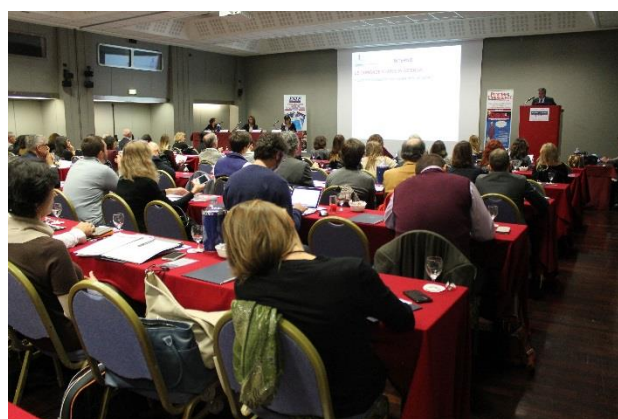
La platea durante l'intervento di un relatore