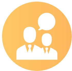
consulenti del lavoro

Il progetto è promosso anche presso i possibili partner di canale HR del territorio di riferimento: