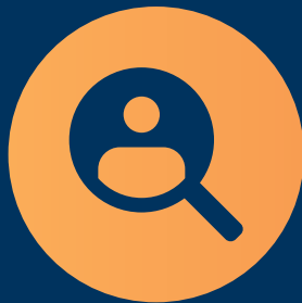
Manager dell'area HR