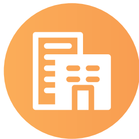
studi professionali area HR