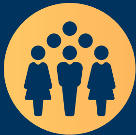
Testimoni di cultura d'impresa e del lavoro