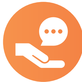
società di consulenza del territorio