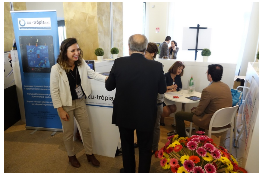
Foto dell'evento «Il Convivio di Persone&Conoscenze» edizione 2017