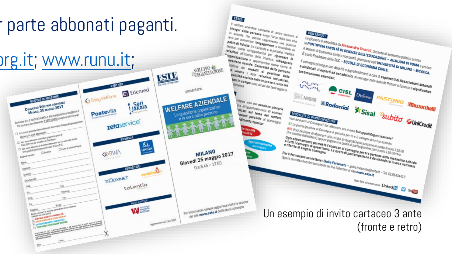
Un esempio di invito cartaceo 3 ante (fronte e retro)