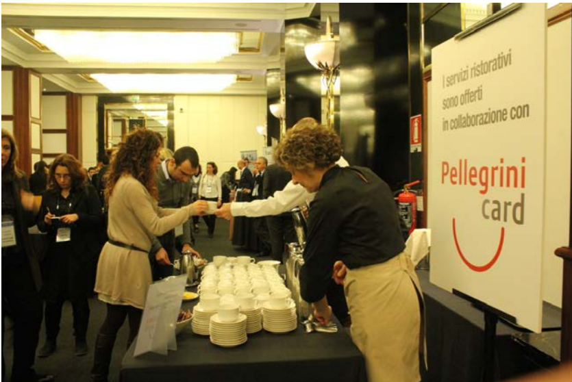
Foto del Convegno «WELFARE AZIENDALE» del 28/1/2016 organizzato al Melià di Milano