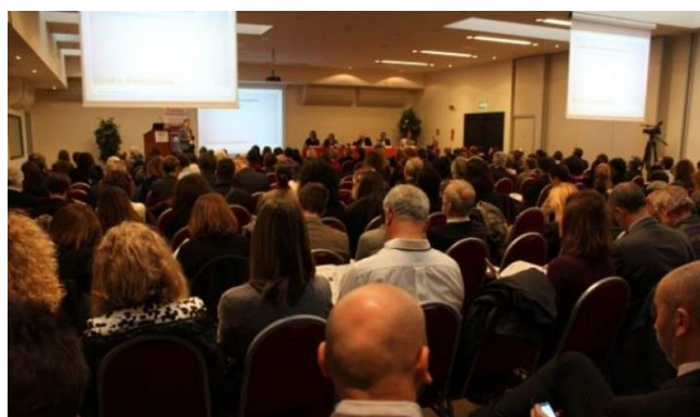
La platea dell'evento