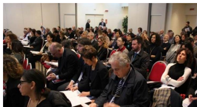
Un altro scatto della platea