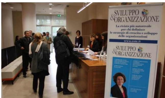
L'accredito degli ospiti