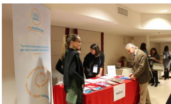
La postazione di un'azienda Sponsor nella zona espositiva