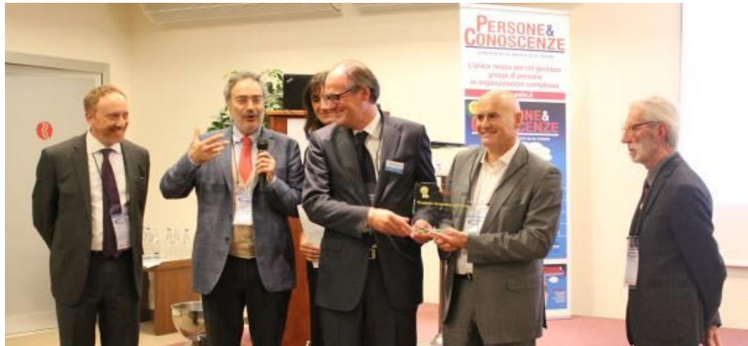
Myequilibrium , vincitore Prodotto formativo dell'anno, I edizione 2014