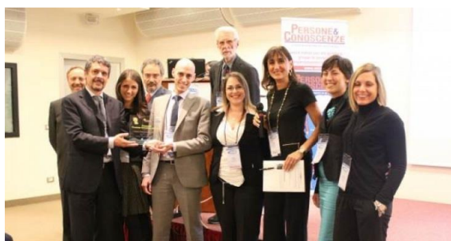
Un momento della premiazione finale del Concorso Prodotto formativo dell'anno