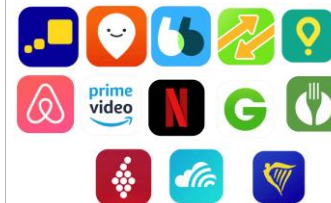
APP easy life