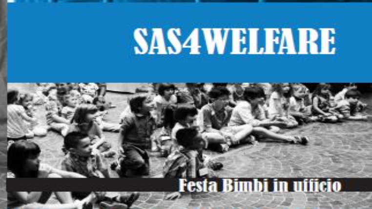
Festa Bimbi in ufficio