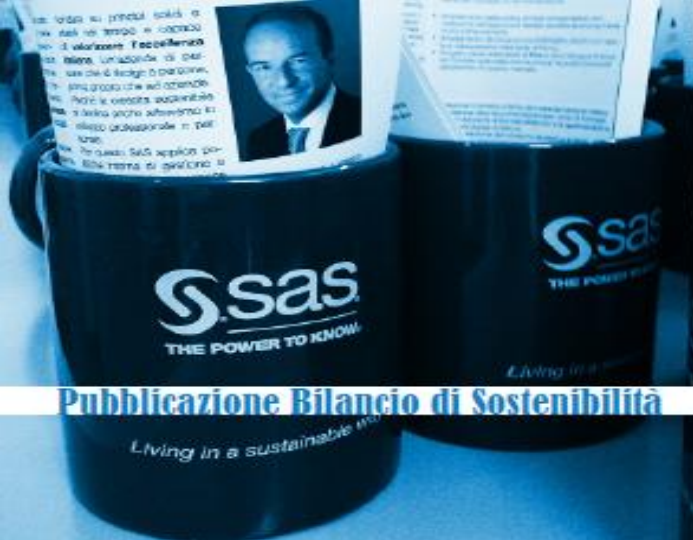
Pubblicazione Bilancio di Sostenibilità