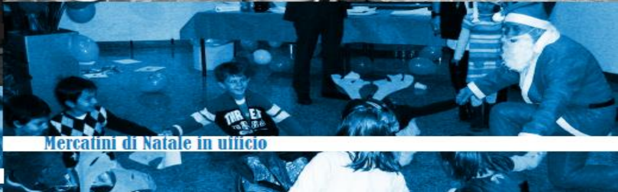
Mercatini di Natale in ufficio