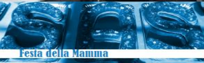
Festa della Mamma