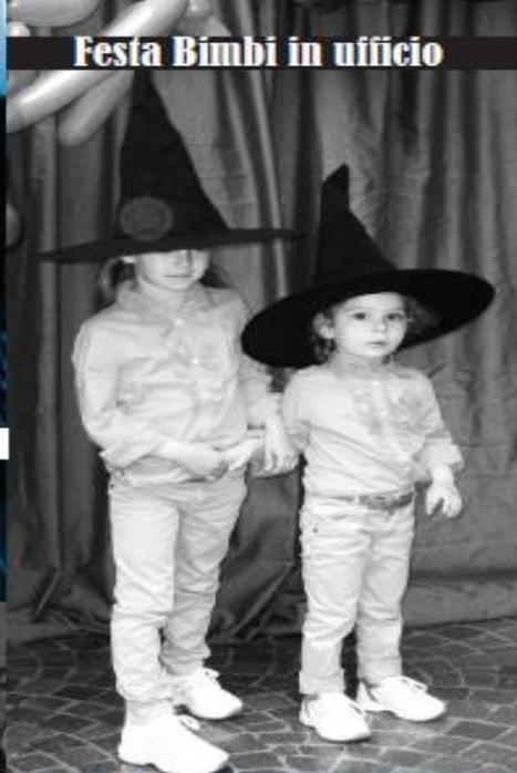
Festa Bimbi in ufficio