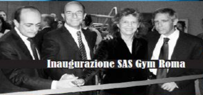
Inaugurazione SAS Gym Roma