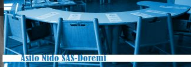
Asilo Nido SAS-Doremi