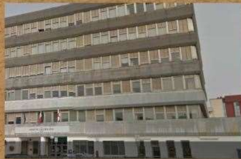
VIA OGLIO 18