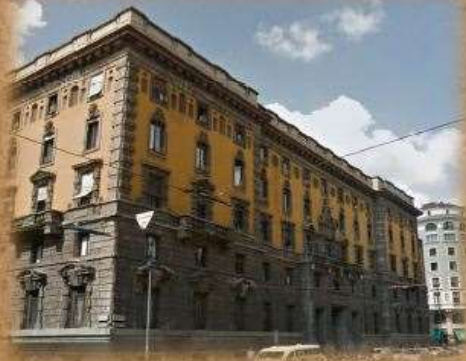
VIA LARGA 12