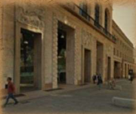
MUSEO DEL '900