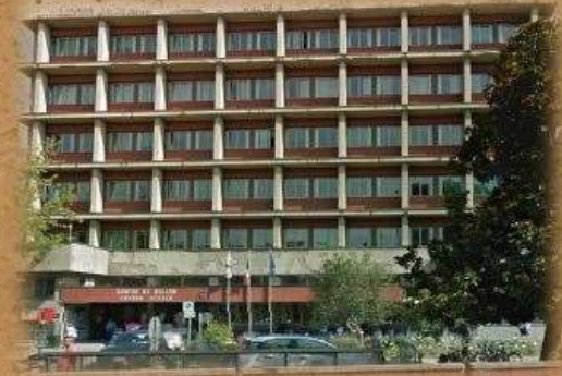
VIA TIBALDI 41