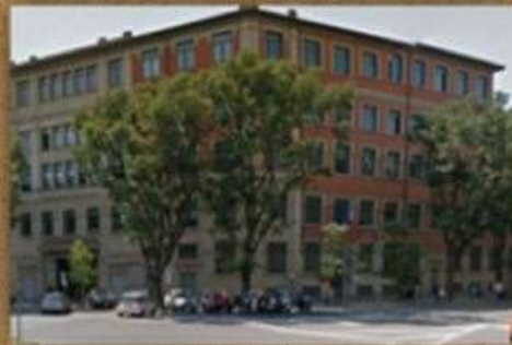
VIA BERGOGNONE 30