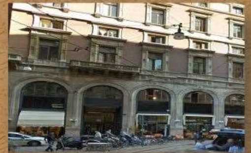
VIA DOGANA 2